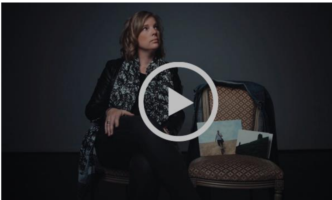
Bear's Den - Crow

Entradas a la venta: el jueves 9 de mayo a las 10 a.m. en Livenation.es, Ticketmaster.es + Red Ticketmaster y en Coconcert.com